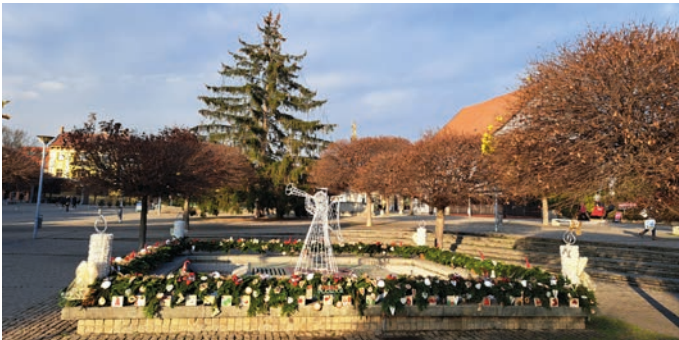
Adventný veniec vyzdobili deti základných škôl