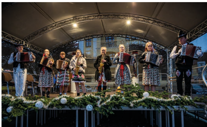
Mladý heligon z Rabčíc