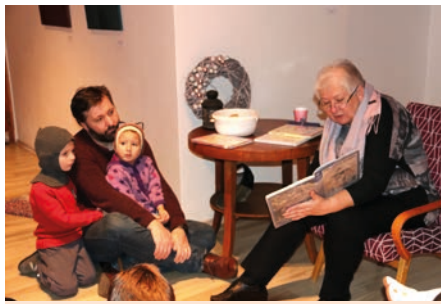
Matica slovenská v Advente - čítanie rozprávok