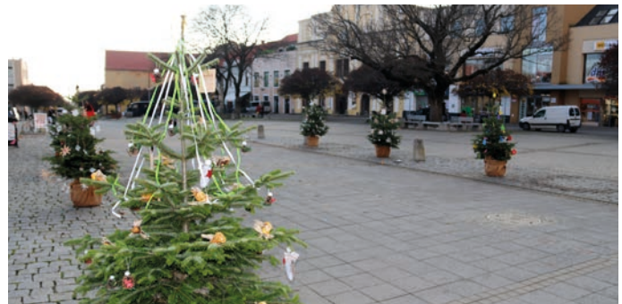
Vianočnú atmosféru dotvárala alej vianočných stromčekov