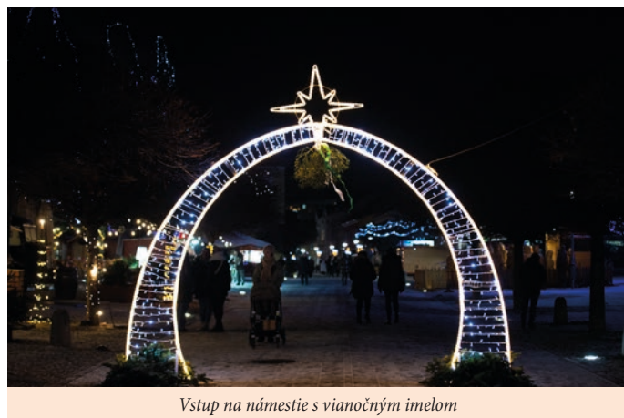
Vstup na námestie s vianočným imelom