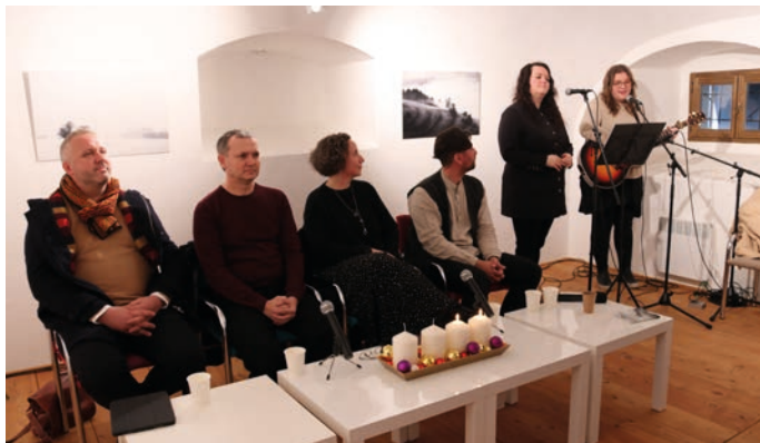
Knihu Do ticha nad krajinou vypravdali medzi čitateľov piesňou