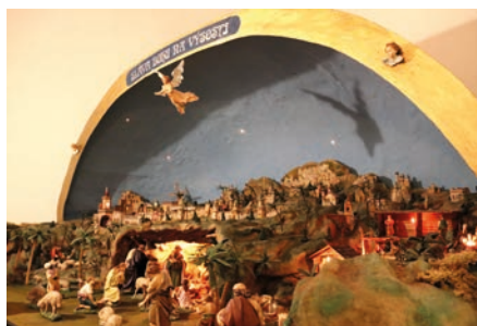
Pohyblivý betlehem v Podjavorinskom múzeu