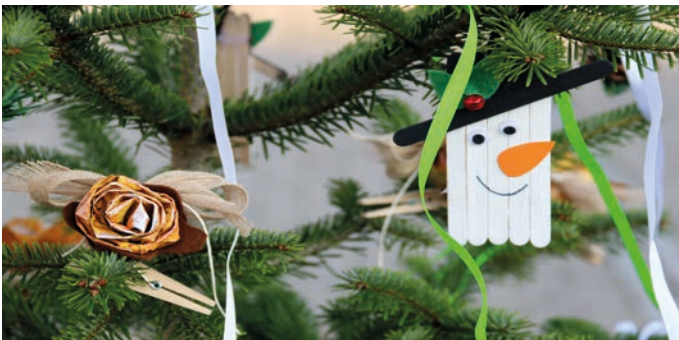
Na stromčekoch sa vynímali originálne vianočné ozdoby

Jeden zo stromčekov patril aj deťom z MŠ na ul. Hollého. Malý predškoláci so svojimi pani učiteľkami ho vyzdobili žiarivo žltými vianočnými guľami. „Rozhodli sme sa pre výrobu netradičných farebných vianočných