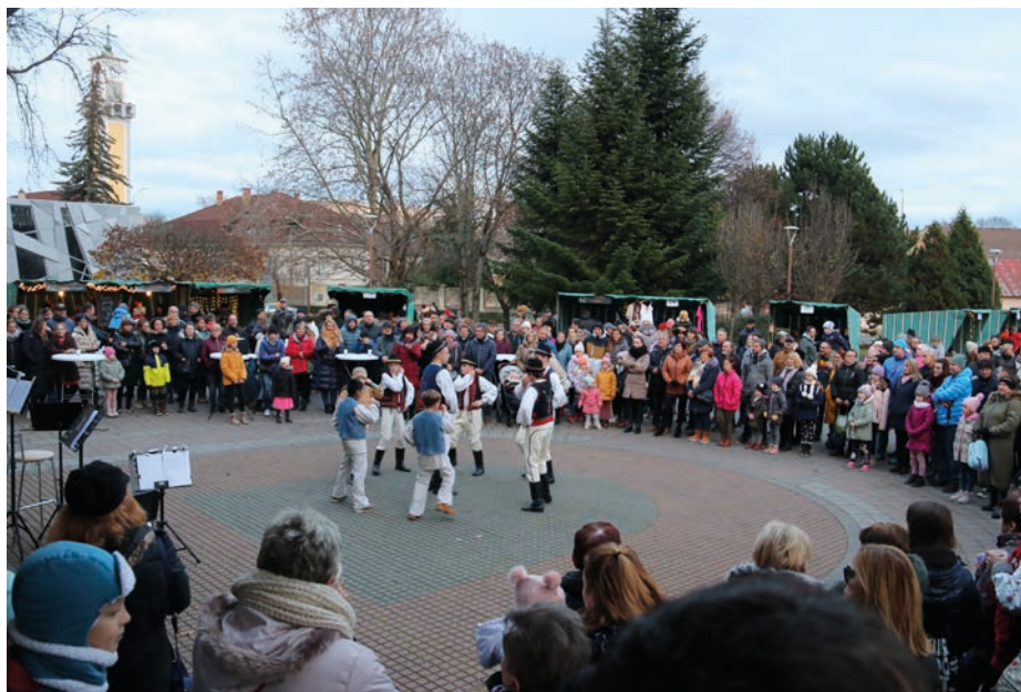
Vianočný mestský trhík a DFS Čakanka

Novomešťania i návštevníci mesta mali teda možnosť pred budovou MsKS navštíviť vianočný Mestský trhík, ďalej bola priprave-