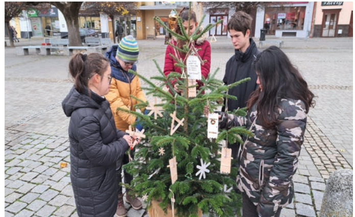
Vianočné stromčeky vyzdobili deti vlastnoručne vyrobenými ozdobami