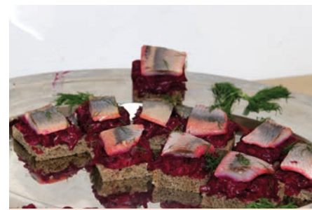
Ako chutia Vianoce - tradičné ukrajinské jedlá