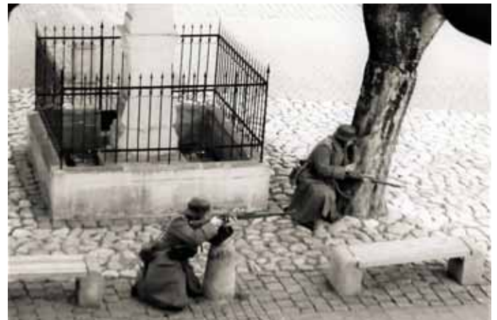
Nemeckí vojaci na novomestskom námestí. Fotografia z rekonštrukcie oslobodzovacích bojov zo dňa 7. apríla 2015.