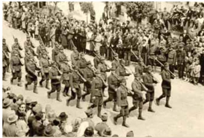
Pochodujúci rumunskí vojaci počas osláv oslobodenia a konca 2. sv. vojny v Novom Meste nad Váhom.

Čoskoro po Rumunoch prišli do mesta aj vojaci Červenej armády. Začalo obdobie, keď sa mesto stalo načas sídlom pomerne veľkého počtu vojakov obidvoch armád. Obyvatelia mesta sa síce cítili slobodní, ale aj oni sa museli prispôbiť vojnovým pomerom, pretože vojna sa ešte neskónčila a bojovalo sa ani nie príliš ďaleko od Nového Mesta. Z viacerých