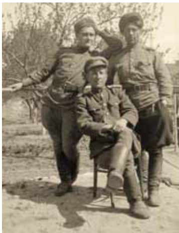
Ruskí vojaci na dvore jedného z novomestských domov.

miestnil ku svojej rodine do pivničných priestorov. Desivé boli výbuchy bômb, ktoré zhadzovali sovietske lietadlá na kraj mesta, ale niektoré dopadli priamo na mesto. Jedna vybuchla neďaleko od domu Matejkovcov, do miestneho potoka. Výbuch bol taký prudký, že „zem sa nám zatriasla pod nohami a petrolejová lampa zhasla“. Po nálete u manželov prevládla zvedavosť nad strachom, vyšli z pivnice a zašli až na námestie. Naskytl sa im neutešený pohľad - „uprostred námestia ležali dva postrelené kone, ktoré ešte žili, opodiaľ prevalený voz a pod ním človek, ktorý sa zrejme nestačil ukryť“. Na námestí videli aj nemeckých vojakov, boli pri ruinách rožného domu, kde bývala cukráreň,