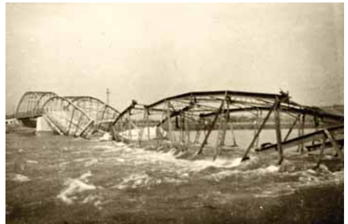
Novomestský most cez rieku Váh zničený pri ústupe nemeckých vojsk 5. apríla 1945.