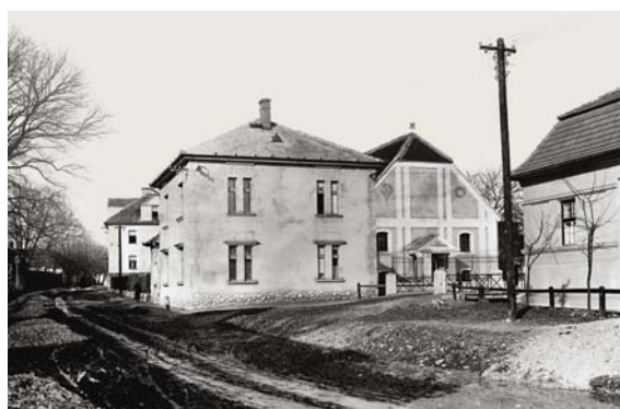
Novostavba evanjelickej fary z roku 1924.

tak, aby sa stala prekážkou pri vstupe do kostola od ulice, čo bolo tiež v súlade s Tolerančným patentom. Táto stavebná situácia však prestala, samozrejme, vyhovovať v období, keď už boli náboženské nezhody minulosťou. Fara sa teda priveľmi neopravovala a hneď ako sa v r.1922 naskytli financie, ju cirkevníci dali zbúrať. Situovanie novej fary nebolo náhodné. Bola postavená už na inom pozemku ako stará fara, na druhom brehu potoka, aby nezacláňala kostolu a ponechala priestor pre nádvorie, ale i pre stavbu kostolnej veže. Budovu fary dokončili v roku 1923.