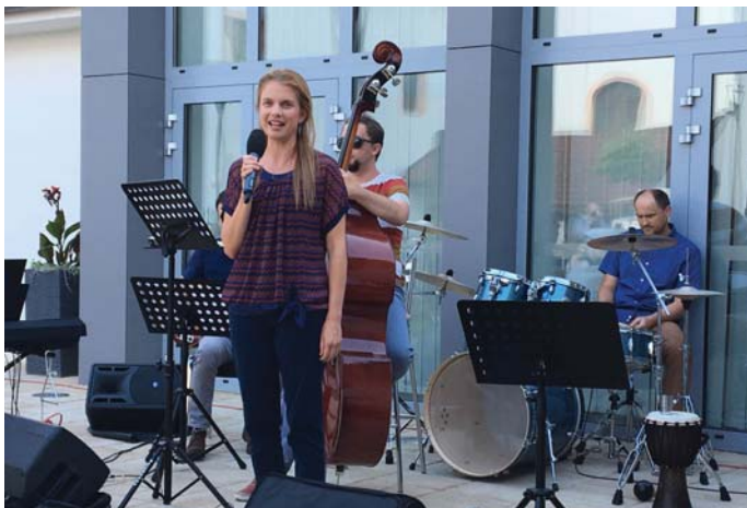
Kapela MsKS počas premiérového koncertu