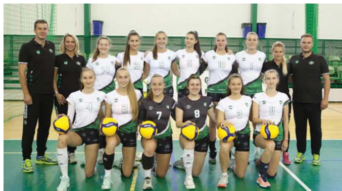
Káder VK Nové Mesto nad Váhom pred štartom novej sezóny.

Ambíciou družstva je pohybovať sa v hornej polovici tabuľky. „V novej sezóne by sme chceli bojovať o prvú štvorku, ale bude to určite náročnejšie než vlani; týmto cieľom sa prezentuje viacero tímov a aj minuloročný