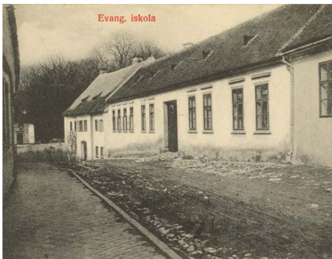
Komenského ulica, bývalá evanjelická škola a budova starej fary, koniec 19. st.

tak, aby sa stala prekážkou pri vstupe do kostola od ulice, čo bolo tiež v súlade s Tolerančným patentom. Táto stavebná situácia však prestala, samozrejme, vyhovovať v období, keď už boli náboženské nezhody minulosťou. Fara sa teda priveľmi neopravovala a hneď ako sa v r.1922 naskytli financie, ju cirkevníci dali zbúrať. Situovanie novej fary nebolo náhodné. Bola postavená už na inom pozemku ako stará fara, na druhom brehu potoka, aby nezacláňala kostolu a ponechala priestor pre nádvorie, ale i pre stavbu kostolnej veže. Budovu fary dokončili v roku 1923.