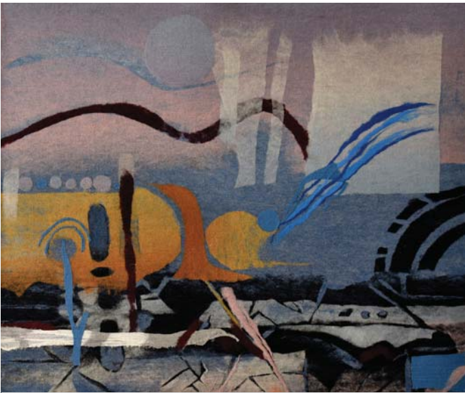
JARNÝ PODVEČER, art protis.