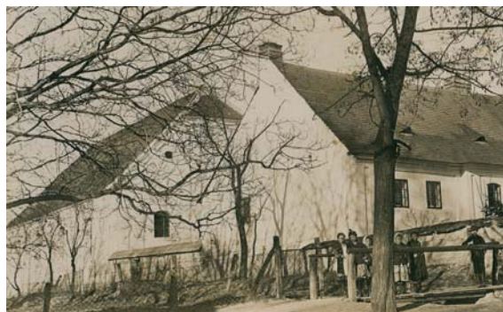
Takto stáli budovy evanjelického kostola a fary od svojho postavenia až do roku 1922.

Onedlho bola postavená aj budova fary, a to