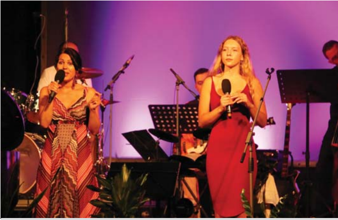
Kapela MsKS počas galavečera pri príležitosti osláv 60. výročia otvorenia MsKS