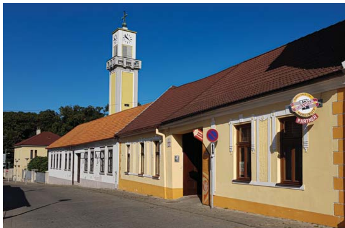
Komenského ulica v súčasnosti, sprava dom č. 3, na jeho mieste stála v r. 1660 evanjelická fara, za ňou bol postavený prvý evanjelický kostol v Novom Meste nad Váhom, nasleduje dom č. 2 – bývalá evanjelická škola.