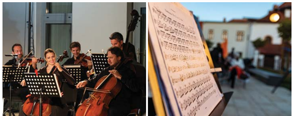
Novomestská Sýpka ožila koncertom vážnej hudby